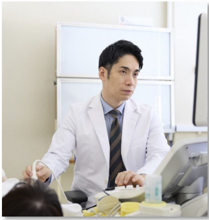
▶きめ細かな検査体制

乳がんは世界で最も罹患される方の多いがんになります。しかしながら、適切な治療により「救うことができる命の多いがん」でもあります。