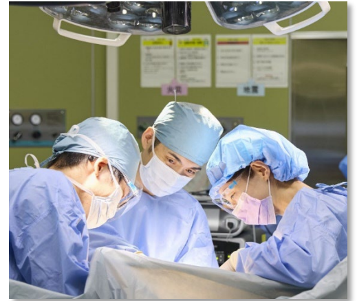
▶質の高い手術の提供

「かかりつけ医の先生方とともにがん診療に取り組む」をモットーに積極的に病診連携を推進しており、その実績は1300件となります。『術後連携パスの徹底』『乳腺診療連携ホットラインの設置』『パートナーシップクリニックの依頼』などにより相乗効果を高め、よりよい病診連携を目指しています。