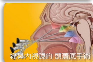
経鼻内視鏡的頭蓋底手術