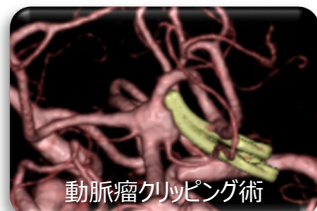
動脈瘤クリッピング術