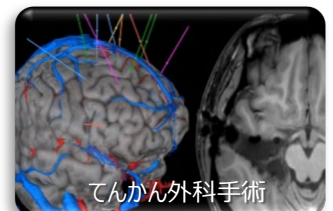
てんかん外科手術