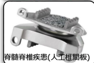
脊髄脊椎疾患(人工椎間板)