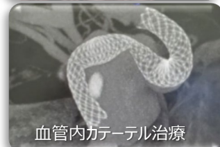
血管内カテーテル治療