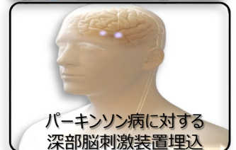
パーキンソン病に対する 深部脳刺激装置埋込

脳神経疾患でお悩みの患者さまに最適な治療を提供できるように尽力いたします。 どうぞお気軽にご相談ください。